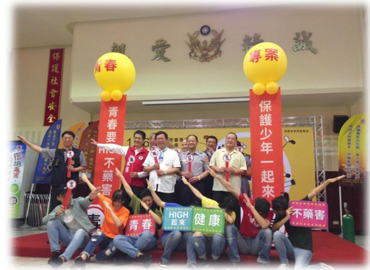
青春專案宣誓活動