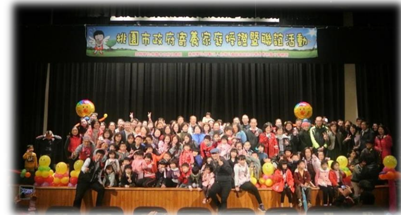
寄養家庭授證暨聯誼活動