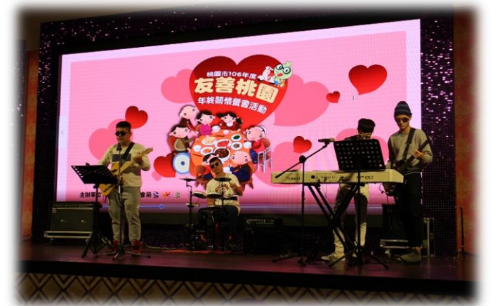
友善桃園年終關懷餐會活動