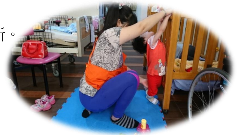
早期療育復健情形