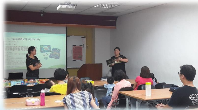
收出養親職教育課程