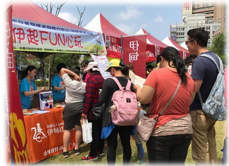
早期療育社區宣導